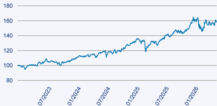
— JPM Middle East, Africa and Emerging Europe Opportunities A Acc EUR

Risiko: Die in der Vergangenheit erzielte Performance und die Erträge lassen keinen Rückschluss auf die zukünftige Performance und die Erträge des Fonds zu. Der Fonds ist weder mit einer Garantie noch mit einem Kapitalschutzmechanismus ausgestattet. Der in Euro umgerechnete Wert internationaler Anlagen des Fonds kann infolge von Wechselkursschwankungen (Währungsschwankungen) sowohl steigen als auch sinken. Der Wert des Fonds und damit der Wert ihres Investments kann gegenüber dem Einstandspreis steigen oder fallen.