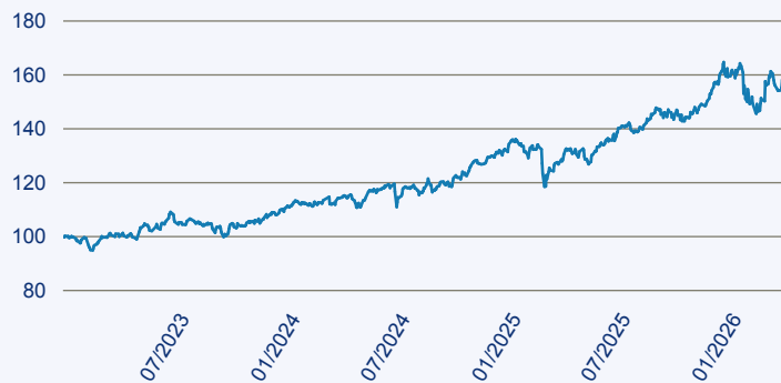
— JPM Middle East, Africa and Emerging Europe Opportunities A Acc EUR

Risiko: Die in der Vergangenheit erzielte Performance und die Erträge lassen keinen Rückschluss auf die zukünftige Performance und die Erträge des Fonds zu. Der Fonds ist weder mit einer Garantie noch mit einem Kapitalschutzmechanismus ausgestattet. Der in Euro umgerechnete Wert internationaler Anlagen des Fonds kann infolge von Wechselkursschwankungen (Währungsschwankungen) sowohl steigen als auch sinken. Der Wert des Fonds und damit der Wert ihres Investments kann gegenüber dem Einstandspreis steigen oder fallen.