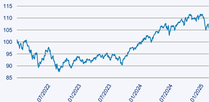
— Swisscanto (LU) Portfolio Fund - Sustainable Balanced (EUR) DT

Risiko: Die in der Vergangenheit erzielte Performance und die Erträge lassen keinen Rückschluss auf die zukünftige Performance und die Erträge des Fonds zu. Der Fonds ist weder mit einer Garantie noch mit einem Kapitalschutzmechanismus ausgestattet. Der in Euro umgerechnete Wert internationaler Anlagen des Fonds kann infolge von Wechselkursschwankungen (Währungsschwankungen) sowohl steigen als auch sinken. Der Wert des Fonds und damit der Wert ihres Investments kann gegenüber dem Einstandspreis steigen oder fallen.