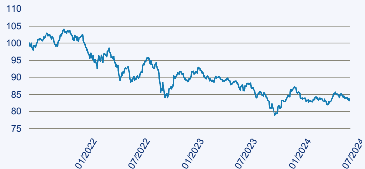
abrnd SICAV II - Multi-Asset Climate Opportunities Fund A Acc EUR

Risiko: Die in der Vergangenheit erzielte Performance und die Ertrage lassen keinen Ruckschluss auf die zukunftige Performance und die Ertrage des Fonds zu. Der Fonds ist weder mit einer Garantie noch mit einem Kapitalschutzmechanismus ausgestattet. Der in Euro umgerechnete Wert internationaler Anlagen des Fonds kann infolge von Wechselkursschwankungen (Wahrungsschwankungen) sowohl steigen als auch sinken. Der Wert des Fonds und damit der Wert ihres Investments kann gegenuber dem Einstandspreis steigen oder fallen.