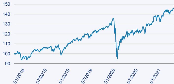
— RobecoSAM Global SDG Equities F EUR

Risiko: Die in der Vergangenheit erzielte Performance und die Erträge lassen keinen Rückschluss auf die zukünftige Performance und die Erträge des Fonds zu. Der Fonds ist weder mit einer Garantie noch mit einem Kapitalschutzmechanismus ausgestattet. Der in Euro umgerechnete Wert internationaler Anlagen des Fonds kann infolge von Wechselkursschwankungen (Währungsschwankungen) sowohl steigen als auch sinken. Der Wert des Fonds und damit der Wert ihres Investments kann gegenüber dem Einstandspreis steigen oder fallen.