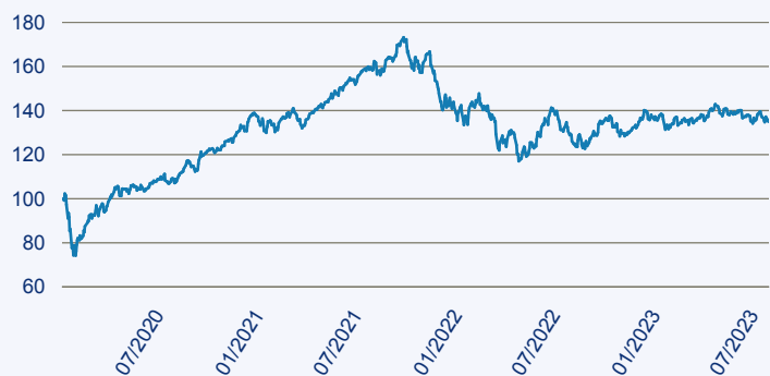
— Aberdeen Standard SICAV I World Smaller Companies Fund

Risiko: Die in der Vergangenheit erzielte Performance und die Erträge lassen keinen Rückschluss auf die zukünftige Performance und die Erträge des Fonds zu. Der Fonds ist weder mit einer Garantie noch mit einem Kapitalschutzmechanismus ausgestattet. Der in Euro umgerechnete Wert internationaler Anlagen des Fonds kann infolge von Wechselkursschwankungen (Währungsschwankungen) sowohl steigen als auch sinken. Der Wert des Fonds und damit der Wert ihres Investments kann gegenüber dem Einstandspreis steigen oder fallen.