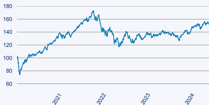
— abrdrn SICAV I - Global Small & Mid-Cap SDG Horizons Equity Fund X Acc EU

Risiko: Die in der Vergangenheit erzielte Performance und die Ertrage lassen keinen Ruckschluss auf die zukunftige Performance und die Ertrage des Fonds zu. Der Fonds ist weder mit einer Garantie noch mit einem Kapitalschutzmechanismus ausgestattet. Der in Euro umgerechnete Wert internationaler Anlagen des Fonds kann infolge von Wechselkursschwankungen (Wahrungsschwankungen) sowohl steigen als auch sinken. Der Wert des Fonds und damit der Wert ihres Investments kann gegenuber dem Einstandspreis steigen oder fallen.