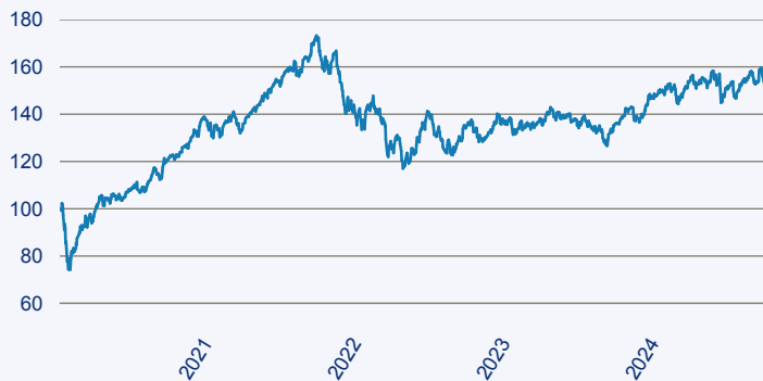
— abrdrn SICAV I - Global Small & Mid-Cap SDG Horizons Equity Fund X Acc EU

Risiko: Die in der Vergangenheit erzielte Performance und die Ertrage lassen keinen Ruckschluss auf die zukunftige Performance und die Ertrage des Fonds zu. Der Fonds ist weder mit einer Garantie noch mit einem Kapitalschutzmechanismus ausgestattet. Der in Euro umgerechnete Wert internationaler Anlagen des Fonds kann infolge von Wechselkursschwankungen (Wahrungsschwankungen) sowohl steigen als auch sinken. Der Wert des Fonds und damit der Wert ihres Investments kann gegenuber dem Einstandspreis steigen oder fallen.