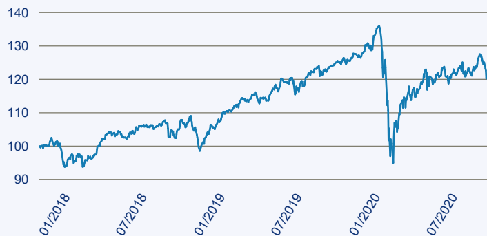
— RobecoSAM Global SDG Equities N EUR

Risiko: Die in der Vergangenheit erzielte Performance und die Erträge lassen keinen Rückschluss auf die zukünftige Performance und die Erträge des Fonds zu. Der Fonds ist weder mit einer Garantie noch mit einem Kapitalschutzmechanismus ausgestattet. Der in Euro umgerechnete Wert internationaler Anlagen des Fonds kann infolge von Wechselkursschwankungen (Währungsschwankungen) sowohl steigen als auch sinken. Der Wert des Fonds und damit der Wert ihres Investments kann gegenüber dem Einstandspreis steigen oder fallen.