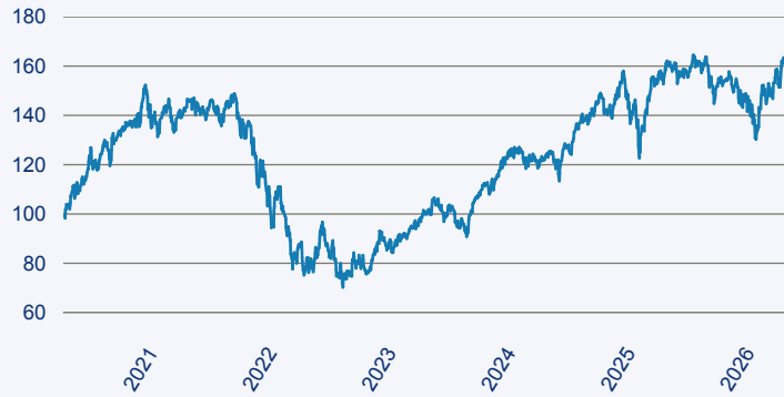
— Morgan Stanley Global Opportunity IH (EUR)

Risiko: Die in der Vergangenheit erzielte Performance und die Ertrage lassen keinen Ruckschluss auf die zukunftige Performance und die Ertrage des Fonds zu. Der Fonds ist weder mit einer Garantie noch mit einem Kapitalschutzmechanismus ausgestattet. Der in Euro umgerechnete Wert internationaler Anlagen des Fonds kann infolge von Wechselkursschwankungen (Wahrungsschwankungen) sowohl steigen als auch sinken. Der Wert des Fonds und damit der Wert ihres Investments kann gegenuber dem Einstandspreis steigen oder fallen.