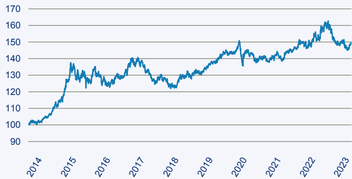
— BlackRock Global Funds - Fixed Income Global Opportunities Fund A2 EUR

Risiko: Die in der Vergangenheit erzielte Performance und die Erträge lassen keinen Rückschluss auf die zukünftige Performance und die Erträge des Fonds zu. Der Fonds ist weder mit einer Garantie noch mit einem Kapitalschutzmechanismus ausgestattet. Der in Euro umgerechnete Wert internationaler Anlagen des Fonds kann infolge von Wechselkursschwankungen (Währungsschwankungen) sowohl steigen als auch sinken. Der Wert des Fonds und damit der Wert ihres Investments kann gegenüber dem Einstandspreis steigen oder fallen.