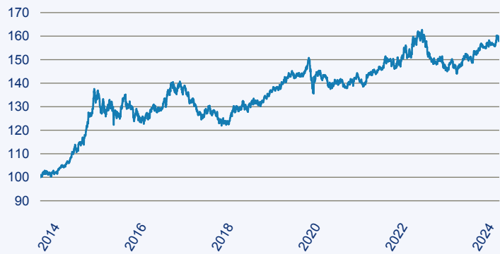
— BlackRock Global Funds - Fixed Income Global Opportunities Fund A2 EUR

Risiko: Die in der Vergangenheit erzielte Performance und die Erträge lassen keinen Rückschluss auf die zukünftige Performance und die Erträge des Fonds zu. Der Fonds ist weder mit einer Garantie noch mit einem Kapitalschutzmechanismus ausgestattet. Der in Euro umgerechnete Wert internationaler Anlagen des Fonds kann infolge von Wechselkurschwankungen (Währungsschwankungen) sowohl steigen als auch sinken. Der Wert des Fonds und damit der Wert ihres Investments kann gegenüber dem Einstandspreis steigen oder fallen.