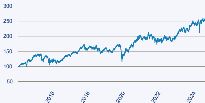
— Invesco Japanese Equity Advantage Fund A (EUR hedged) Acc

Risiko: Die in der Vergangenheit erzielte Performance und die Erträge lassen keinen Rückschluss auf die zukünftige Performance und die Erträge des Fonds zu. Der Fonds ist weder mit einer Garantie noch mit einem Kapitalschutzmechanismus ausgestattet. Der in Euro umgerechnete Wert internationaler Anlagen des Fonds kann infolge von Wechselkursschwankungen (Währungsschwankungen) sowohl steigen als auch sinken. Der Wert des Fonds und damit der Wert ihres Investments kann gegenüber dem Einstandspreis steigen oder fallen.