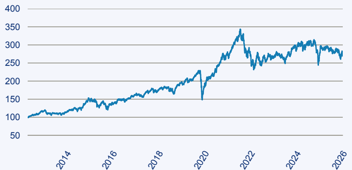
— abrdrn SICAV I - Global Small & Mid-Cap SDG Horizons Equity Fund A Acc EU

Risiko: Die in der Vergangenheit erzielte Performance und die Ertrage lassen keinen Ruckschluss auf die zukunftige Performance und die Ertrage des Fonds zu. Der Fonds ist weder mit einer Garantie noch mit einem Kapitalschutzmechanismus ausgestattet. Der in Euro umgerechnete Wert internationaler Anlagen des Fonds kann infolge von Wechselkursschwankungen (Wahrungsschwankungen) sowohl steigen als auch sinken. Der Wert des Fonds und damit der Wert ihres Investments kann gegenuber dem Einstandspreis steigen oder fallen.