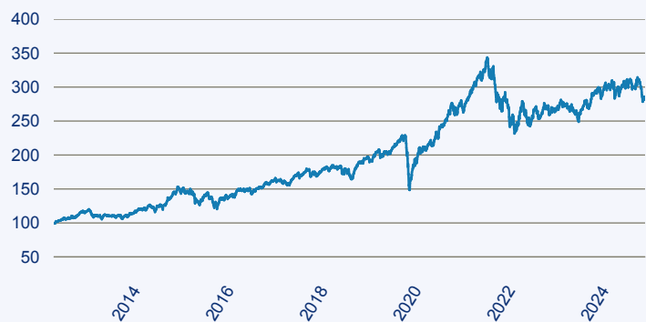
— abrdrn SICAV I - Global Small & Mid-Cap SDG Horizons Equity Fund A Acc EU

Risiko: Die in der Vergangenheit erzielte Performance und die Erträge lassen keinen Rückschluss auf die zukünftige Performance und die Erträge des Fonds zu. Der Fonds ist weder mit einer Garantie noch mit einem Kapitalschutzmechanismus ausgestattet. Der in Euro umgerechnete Wert internationaler Anlagen des Fonds kann infolge von Wechselkursschwankungen (Währungsschwankungen) sowohl steigen als auch sinken. Der Wert des Fonds und damit der Wert ihres Investments kann gegenüber dem Einstandspreis steigen oder fallen.