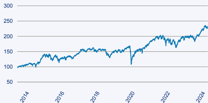
— Janus Henderson Horizon Fund - Pan European Mid and Large Cap Fund A2 EUR

Risiko: Die in der Vergangenheit erzielte Performance und die Ertrage lassen keinen Ruckschluss auf die zukunftige Performance und die Ertrage des Fonds zu. Der Fonds ist weder mit einer Garantie noch mit einem Kapitalschutzmechanismus ausgestattet. Der in Euro umgerechnete Wert internationaler Anlagen des Fonds kann infolge von Wechselkursschwankungen (Wahrungsschwankungen) sowohl steigen als auch sinken. Der Wert des Fonds und damit der Wert ihres Investments kann gegenuber dem Einstandspreis steigen oder fallen.