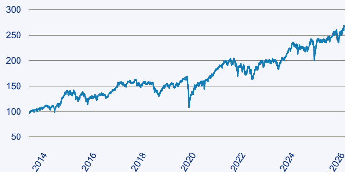
— Janus Henderson Horizon Fund - Pan European Mid and Large Cap Fund A2 EUR

Risiko: Die in der Vergangenheit erzielte Performance und die Ertrage lassen keinen Ruckschluss auf die zukunftige Performance und die Ertrage des Fonds zu. Der Fonds ist weder mit einer Garantie noch mit einem Kapitalschutzmechanismus ausgestattet. Der in Euro umgerechnete Wert internationaler Anlagen des Fonds kann infolge von Wechselkursschwankungen (Wahrungsschwankungen) sowohl steigen als auch sinken. Der Wert des Fonds und damit der Wert ihres Investments kann gegenuber dem Einstandspreis steigen oder fallen.