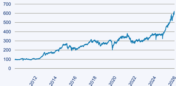
abrdrn SICAV I - Japanese Smaller Companies Sustainable Equity A Acc Hedged E

Risiko: Die in der Vergangenheit erzielte Performance und die Ertrage lassen keinen Ruckschluss auf die zukunftige Performance und die Ertrage des Fonds zu. Der Fonds ist weder mit einer Garantie noch mit einem Kapitalschutzmechanismus ausgestattet. Der in Euro umgerechnete Wert internationaler Anlagen des Fonds kann infolge von Wechselkursschwankungen (Wahrungsschwankungen) sowohl steigen als auch sinken. Der Wert des Fonds und damit der Wert ihres Investments kann gegenuber dem Einstandspreis steigen oder fallen.