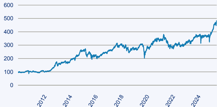
abrnd SICAV I - Japanese Smaller Companies Sustainable Equity A Acc Hedged E

Risiko: Die in der Vergangenheit erzielte Performance und die Ertrage lassen keinen Ruckschluss auf die zukunftliche Performance und die Ertrage des Fonds zu. Der Fonds ist weder mit einer Garantie noch mit einem Kapitalschutzmechanismus ausgestattet. Der in Euro umgerechnete Wert internationaler Anlagen des Fonds kann infolge von Wechselkursschwankungen (Wahrungsschwankungen) sowohl steigen als auch sinken. Der Wert des Fonds und damit der Wert ihres Investments kann gegenuber dem Einstandspreis steigen oder fallen.