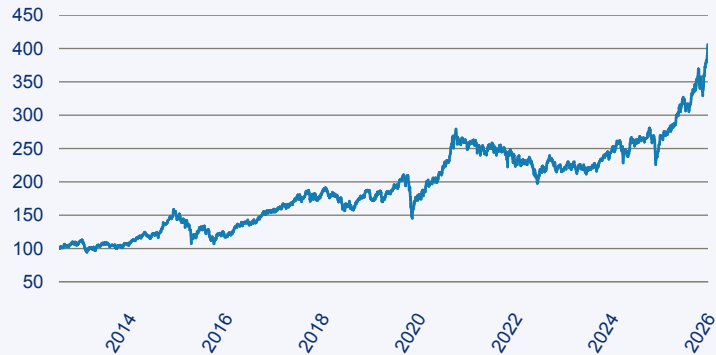
— JPM Asia Pacific Equity C (acc) - EUR

Risiko: Die in der Vergangenheit erzielte Performance und die Erträge lassen keinen Rückschluss auf die zukünftige Performance und die Erträge des Fonds zu. Der Fonds ist weder mit einer Garantie noch mit einem Kapitalschutzmechanismus ausgestattet. Der in Euro umgerechnete Wert internationaler Anlagen des Fonds kann infolge von Wechselkursschwankungen (Währungsschwankungen) sowohl steigen als auch sinken. Der Wert des Fonds und damit der Wert ihres Investments kann gegenüber dem Einstandspreis steigen oder fallen.