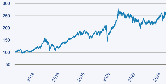
— JPM Asia Pacific Equity C (acc) - EUR

Risiko: Die in der Vergangenheit erzielte Performance und die Erträge lassen keinen Rückschluss auf die zukünftige Performance und die Erträge des Fonds zu. Der Fonds ist weder mit einer Garantie noch mit einem Kapitalschutzmechanismus ausgestattet. Der in Euro umgerechnete Wert internationaler Anlagen des Fonds kann infolge von Wechselkursschwankungen (Währungsschwankungen) sowohl steigen als auch sinken. Der Wert des Fonds und damit der Wert ihres Investments kann gegenüber dem Einstandspreis steigen oder fallen.