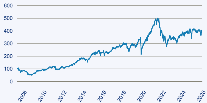
abrnd SICAV II - European Smaller Companies Fund A Acc EUR

Risiko: Die in der Vergangenheit erzielte Performance und die Ertrage lassen keinen Ruckschluss auf die zukunftige Performance und die Ertrage des Fonds zu. Der Fonds ist weder mit einer Garantie noch mit einem Kapitalschutzmechanismus ausgestattet. Der in Euro umgerechnete Wert internationaler Anlagen des Fonds kann infolge von Wechselkursschwankungen (Wahrungsschwankungen) sowohl steigen als auch sinken. Der Wert des Fonds und damit der Wert ihres Investments kann gegenuber dem Einstandspreis steigen oder fallen.