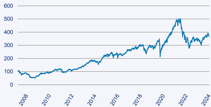
— AS SICAV II - European Smaller Companies Fund A thes.

Risiko: Die in der Vergangenheit erzielte Performance und die Erträge lassen keinen Rückschluss auf die zukünftige Performance und die Erträge des Fonds zu. Der Fonds ist weder mit einer Garantie noch mit einem Kapitalschutzmechanismus ausgestattet. Der in Euro umgerechnete Wert internationaler Anlagen des Fonds kann infolge von Wechselkursschwankungen (Währungsschwankungen) sowohl steigen als auch sinken. Der Wert des Fonds und damit der Wert ihres Investments kann gegenüber dem Einstandspreis steigen oder fallen.