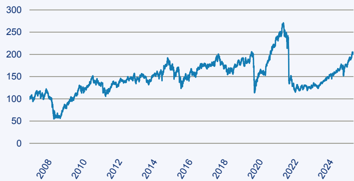
— Fidelity Funds - Emerging Europe, Middle East and Africa Fund A-ACC-Euro

Risiko: Die in der Vergangenheit erzielte Performance und die Erträge lassen keinen Rückschluss auf die zukünftige Performance und die Erträge des Fonds zu. Der Fonds ist weder mit einer Garantie noch mit einem Kapitalschutzmechanismus ausgestattet. Der in Euro umgerechnete Wert internationaler Anlagen des Fonds kann infolge von Wechselkursschwankungen (Währungsschwankungen) sowohl steigen als auch sinken. Der Wert des Fonds und damit der Wert ihres Investments kann gegenüber dem Einstandspreis steigen oder fallen.