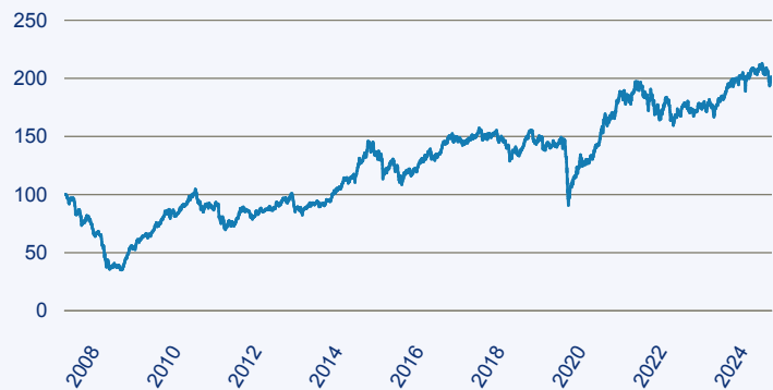
— Templeton Emerging Markets Smaller Companies Fund A (acc) EUR

Risiko: Die in der Vergangenheit erzielte Performance und die Erträge lassen keinen Rückschluss auf die zukünftige Performance und die Erträge des Fonds zu. Der Fonds ist weder mit einer Garantie noch mit einem Kapitalschutzmechanismus ausgestattet. Der in Euro umgerechnete Wert internationaler Anlagen des Fonds kann infolge von Wechselkursschwankungen (Währungsschwankungen) sowohl steigen als auch sinken. Der Wert des Fonds und damit der Wert ihres Investments kann gegenüber dem Einstandspreis steigen oder fallen.