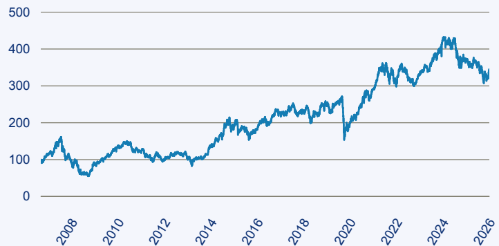
— BlackRock Global Funds India D2

Risiko: Die in der Vergangenheit erzielte Performance und die Ertrage lassen keinen Ruckschluss auf die zukunftige Performance und die Ertrage des Fonds zu. Der Fonds ist weder mit einer Garantie noch mit einem Kapitalschutzmechanismus ausgestattet. Der in Euro umgerechnete Wert internationaler Anlagen des Fonds kann infolge von Wechselkursschwankungen (Wahrungsschwankungen) sowohl steigen als auch sinken. Der Wert des Fonds und damit der Wert ihres Investments kann gegenuber dem Einstandspreis steigen oder fallen.