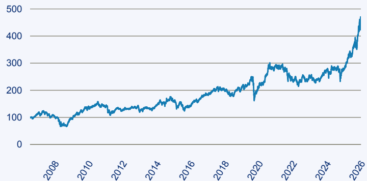
— Schroder ISF Global Emerging Market Opportunities EUR C ACC

Risiko: Die in der Vergangenheit erzielte Performance und die Erträge lassen keinen Rückschluss auf die zukünftige Performance und die Erträge des Fonds zu. Der Fonds ist weder mit einer Garantie noch mit einem Kapitalschutzmechanismus ausgestattet. Der in Euro umgerechnete Wert internationaler Anlagen des Fonds kann infolge von Wechselkursschwankungen (Währungsschwankungen) sowohl steigen als auch sinken. Der Wert des Fonds und damit der Wert ihres Investments kann gegenüber dem Einstandspreis steigen oder fallen.