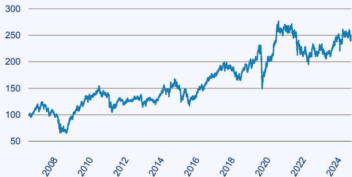
— SCHRODER ISF Global Emerging Markets Opportunities

Risiko: Die in der Vergangenheit erzielte Performance und die Erträge lassen keinen Rückschluss auf die zukünftige Performance und die Erträge des Fonds zu. Der Fonds ist weder mit einer Garantie noch mit einem Kapitalschutzmechanismus ausgestattet. Der in Euro umgerechnete Wert internationaler Anlagen des Fonds kann infolge von Wechselkursschwankungen (Währungsschwankungen) sowohl steigen als auch sinken. Der Wert des Fonds und damit der Wert ihres Investments kann gegenüber dem Einstandspreis steigen oder fallen.