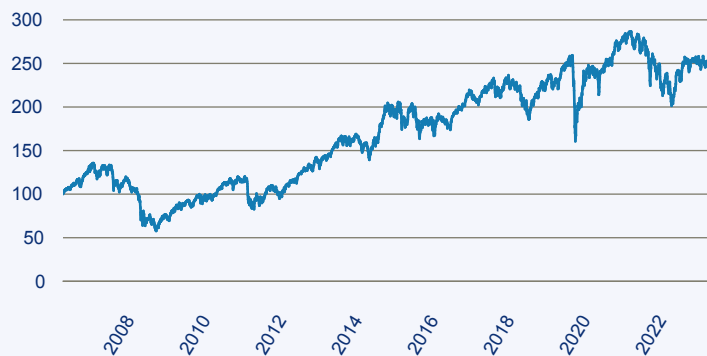
— Fidelity Funds - Germany Fund A Acc

Risiko: Die in der Vergangenheit erzielte Performance und die Erträge lassen keinen Rückschluss auf die zukünftige Performance und die Erträge des Fonds zu. Der Fonds ist weder mit einer Garantie noch mit einem Kapitalschutzmechanismus ausgestattet. Der in Euro umgerechnete Wert internationaler Anlagen des Fonds kann infolge von Wechselkursschwankungen (Währungsschwankungen) sowohl steigen als auch sinken. Der Wert des Fonds und damit der Wert ihres Investments kann gegenüber dem Einstandspreis steigen oder fallen.