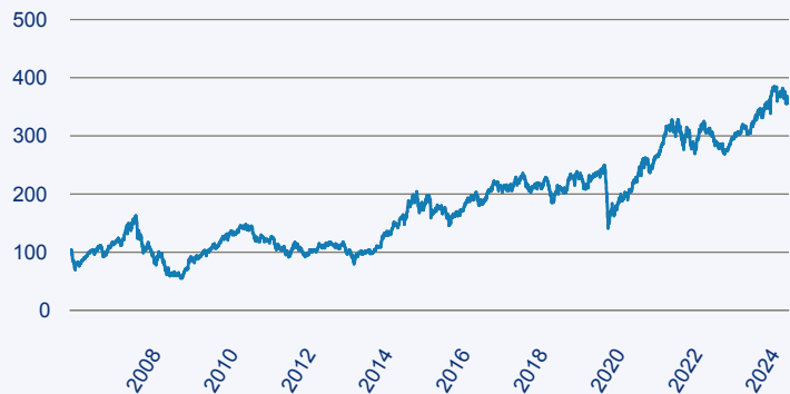
— BlackRock Global Funds - India Fund A2 EUR

Risiko: Die in der Vergangenheit erzielte Performance und die Erträge lassen keinen Rückschluss auf die zukünftige Performance und die Erträge des Fonds zu. Der Fonds ist weder mit einer Garantie noch mit einem Kapitalschutzmechanismus ausgestattet. Der in Euro umgerechnete Wert internationaler Anlagen des Fonds kann infolge von Wechselkursschwankungen (Währungsschwankungen) sowohl steigen als auch sinken. Der Wert des Fonds und damit der Wert ihres Investments kann gegenüber dem Einstandspreis steigen oder fallen.