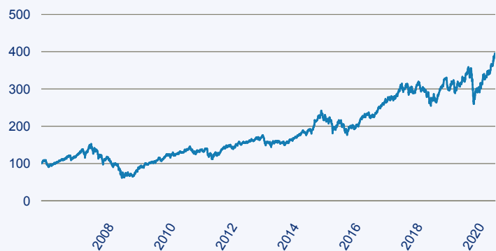
— Schroder ISF Asian Opports C Acc EUR

Risiko: Die in der Vergangenheit erzielte Performance und die Erträge lassen keinen Rückschluss auf die zukünftige Performance und die Erträge des Fonds zu. Der Fonds ist weder mit einer Garantie noch mit einem Kapitalschutzmechanismus ausgestattet. Der in Euro umgerechnete Wert internationaler Anlagen des Fonds kann infolge von Wechselkursschwankungen (Währungsschwankungen) sowohl steigen als auch sinken. Der Wert des Fonds und damit der Wert ihres Investments kann gegenüber dem Einstandspreis steigen oder fallen.