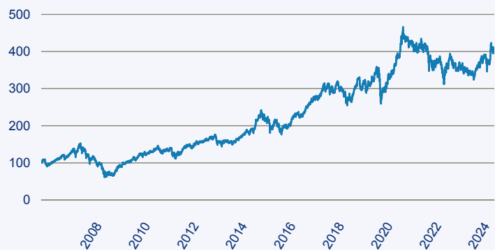
— Schroder ISF Asian Opportunities C Thesaurierend EUR

Risiko: Die in der Vergangenheit erzielte Performance und die Erträge lassen keinen Rückschluss auf die zukünftige Performance und die Erträge des Fonds zu. Der Fonds ist weder mit einer Garantie noch mit einem Kapitalschutzmechanismus ausgestattet. Der in Euro umgerechnete Wert internationaler Anlagen des Fonds kann infolge von Wechselkursschwankungen (Währungsschwankungen) sowohl steigen als auch sinken. Der Wert des Fonds und damit der Wert ihres Investments kann gegenüber dem Einstandspreis steigen oder fallen.