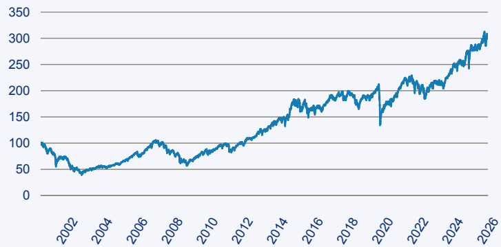
— Invesco Sustainable Pan European Systematic Equity Fund A Acc EUR

Risiko: Die in der Vergangenheit erzielte Performance und die Erträge lassen keinen Rückschluss auf die zukünftige Performance und die Erträge des Fonds zu. Der Fonds ist weder mit einer Garantie noch mit einem Kapitalschutzmechanismus ausgestattet. Der in Euro umgerechnete Wert internationaler Anlagen des Fonds kann infolge von Wechselkursschwankungen (Währungsschwankungen) sowohl steigen als auch sinken. Der Wert des Fonds und damit der Wert ihres Investments kann gegenüber dem Einstandspreis steigen oder fallen.