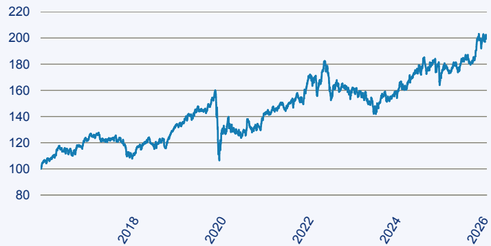
— First Sentier Global Listed Infrastructure Fund I (Accumulation) EUR

Risiko: Die in der Vergangenheit erzielte Performance und die Ertrage lassen keinen Ruckschluss auf die zukunftige Performance und die Ertrage des Fonds zu. Der Fonds ist weder mit einer Garantie noch mit einem Kapitalschutzmechanismus ausgestattet. Der in Euro umgerechnete Wert internationaler Anlagen des Fonds kann infolge von Wechselkursschwankungen (Wahrungsschwankungen) sowohl steigen als auch sinken. Der Wert des Fonds und damit der Wert ihres Investments kann gegenuber dem Einstandspreis steigen oder fallen.