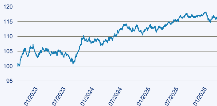
— Vanguard ESG Global Corporate Bond Index Fund EUR Hedged Acc

Risiko: Die in der Vergangenheit erzielte Performance und die Erträge lassen keinen Rückschluss auf die zukünftige Performance und die Erträge des Fonds zu. Der Fonds ist weder mit einer Garantie noch mit einem Kapitalschutzmechanismus ausgestattet. Der in Euro umgerechnete Wert internationaler Anlagen des Fonds kann infolge von Wechselkursschwankungen (Währungsschwankungen) sowohl steigen als auch sinken. Der Wert des Fonds und damit der Wert ihres Investments kann gegenüber dem Einstandspreis steigen oder fallen.