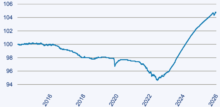
— Dimensional Funds - Global Ultra Short Fixed Income Fund EUR Accumulation Cla

Risiko: Die in der Vergangenheit erzielte Performance und die Ertrage lassen keinen Ruckschluss auf die zukunftige Performance und die Ertrage des Fonds zu. Der Fonds ist weder mit einer Garantie noch mit einem Kapitalschutzmechanismus ausgestattet. Der in Euro umgerechnete Wert internationaler Anlagen des Fonds kann infolge von Wechselkursschwankungen (Wahrungsschwankungen) sowohl steigen als auch sinken. Der Wert des Fonds und damit der Wert ihres Investments kann gegenuber dem Einstandspreis steigen oder fallen.