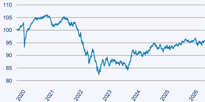
— Dimensional Global Core Fixed Income Lower Carbon ESG Screened Fund EUR A

Risiko: Die in der Vergangenheit erzielte Performance und die Ertrage lassen keinen Ruckschluss auf die zukunftige Performance und die Ertrage des Fonds zu. Der Fonds ist weder mit einer Garantie noch mit einem Kapitalschutzmechanismus ausgestattet. Der in Euro umgerechnete Wert internationaler Anlagen des Fonds kann infolge von Wechselkursschwankungen (Wahrungsschwankungen) sowohl steigen als auch sinken. Der Wert des Fonds und damit der Wert ihres Investments kann gegenuber dem Einstandspreis steigen oder fallen.