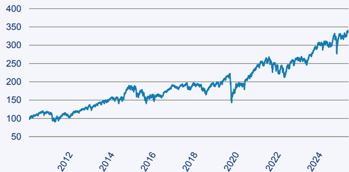
— Vanguard Investment Series PLC - Vanguard ESG Developed Europe Index Fund E

Risiko: Die in der Vergangenheit erzielte Performance und die Erträge lassen keinen Rückschluss auf die zukünftige Performance und die Erträge des Fonds zu. Der Fonds ist weder mit einer Garantie noch mit einem Kapitalschutzmechanismus ausgestattet. Der in Euro umgerechnete Wert internationaler Anlagen des Fonds kann infolge von Wechselkursschwankungen (Währungsschwankungen) sowohl steigen als auch sinken. Der Wert des Fonds und damit der Wert ihres Investments kann gegenüber dem Einstandspreis steigen oder fallen.