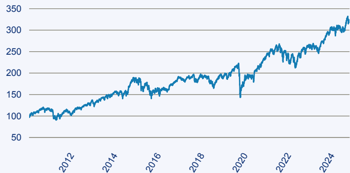
— Vanguard Investment Series PLC - Vanguard ESG Developed Europe Index Fund E

Risiko: Die in der Vergangenheit erzielte Performance und die Erträge lassen keinen Rückschluss auf die zukünftige Performance und die Erträge des Fonds zu. Der Fonds ist weder mit einer Garantie noch mit einem Kapitalschutzmechanismus ausgestattet. Der in Euro umgerechnete Wert internationaler Anlagen des Fonds kann infolge von Wechselkursschwankungen (Währungsschwankungen) sowohl steigen als auch sinken. Der Wert des Fonds und damit der Wert ihres Investments kann gegenüber dem Einstandspreis steigen oder fallen.