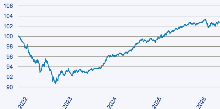
— Dimensional Global Short Fixed Income Lower Carbon ESG Screened Fund EUR A

Risiko: Die in der Vergangenheit erzielte Performance und die Erträge lassen keinen Rückschluss auf die zukünftige Performance und die Erträge des Fonds zu. Der Fonds ist weder mit einer Garantie noch mit einem Kapitalschutzmechanismus ausgestattet. Der in Euro umgerechnete Wert internationaler Anlagen des Fonds kann infolge von Wechselkursschwankungen (Währungsschwankungen) sowohl steigen als auch sinken. Der Wert des Fonds und damit der Wert ihres Investments kann gegenüber dem Einstandspreis steigen oder fallen.