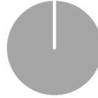
2. Taxonomie-Konformität der Investitionen ohne Staatsanleihen*